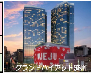
グランドハイアット済州