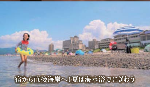
宿から直接海岸へ！夏は海水浴でにぎわう