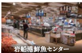
岩船港鮮魚センター