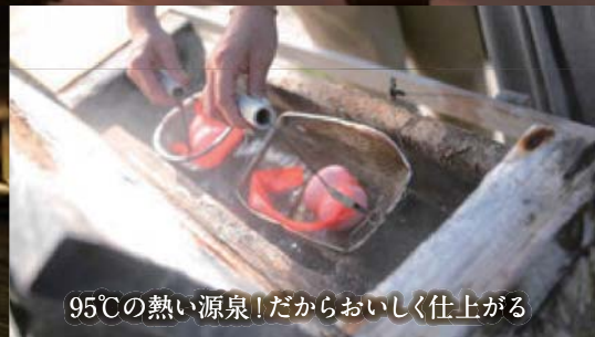
95℃の熱い源泉！だからおいしく仕上がる