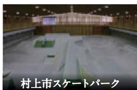
村上市スケートパーク