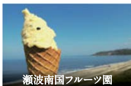
瀬波南国フルーツ園