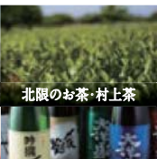
北限のお茶・村上茶