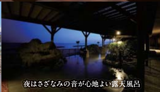
夜はさざなみの音が心地よい露天風呂