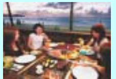
バーベキュー(イメージ)