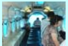
アトランティスサブマリン(イメージ)

上記 か のうち1つ(お1人様・同グループ、同コース)に参加可能です。おトクに参加してグアムを満喫しよう