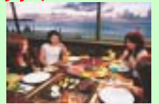
バーベキュー(イメージ)